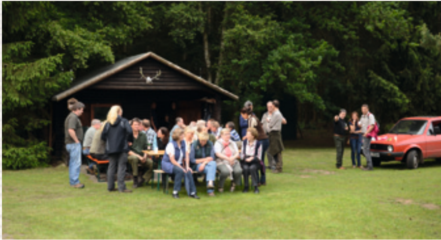
Reviervang des Hegering Zeven in Wehldorf im Juni 2015

An einem Reviervang im Wehldorfer Holz haben viele Jäger und Interessierte teilgenommen. Im Anschluss nutzten sie die Zeit für einen kleinen Plausch an der Jagdhütte.