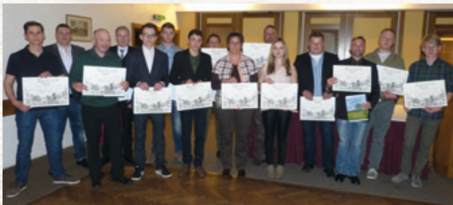
Die 15 Jungjäger nach bestandener Jägerprüfung mit Jägerbrief des Lehrgangs 2014/2015