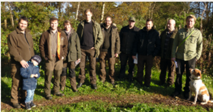
Der Jungjäger-Vorbereitungslehrgang 2015/2016 der Jägerschaft Zeven und Jägerschaft Bremervörde: