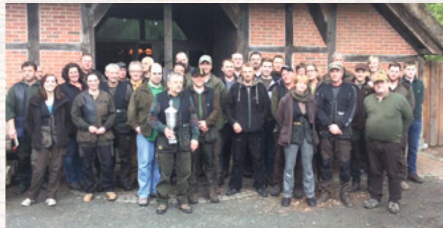
Die Sieger der Kreismeisterschaft 2015