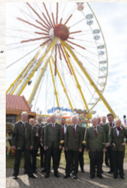
Die Jagdhornbläser auf der Tarmstedter Ausstellung