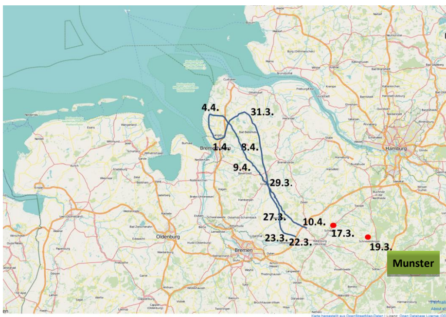
Abb. 2: Ungefähre Route eines Jungwolves im März/April 2015. Die Herkunft des Tieres ist bislang unbekannt.

Eine ähnliche Situation ergab sich Ende März bis Anfang April in den Landkreisen Rotenburg und Cuxhaven. Auch hier dokumentieren diverse Nahkontakte die Wanderung eines Jungwolves. Im ersten Quartal 2015 wurden aus dieser Region sieben C1-Nachweise und zehn C3-Hinweise innerhalb von zehn Tagen gemeldet. Genetische Ergebnisse, die Auskunft über die Herkunft des Tieres geben können, stehen bislang noch aus.