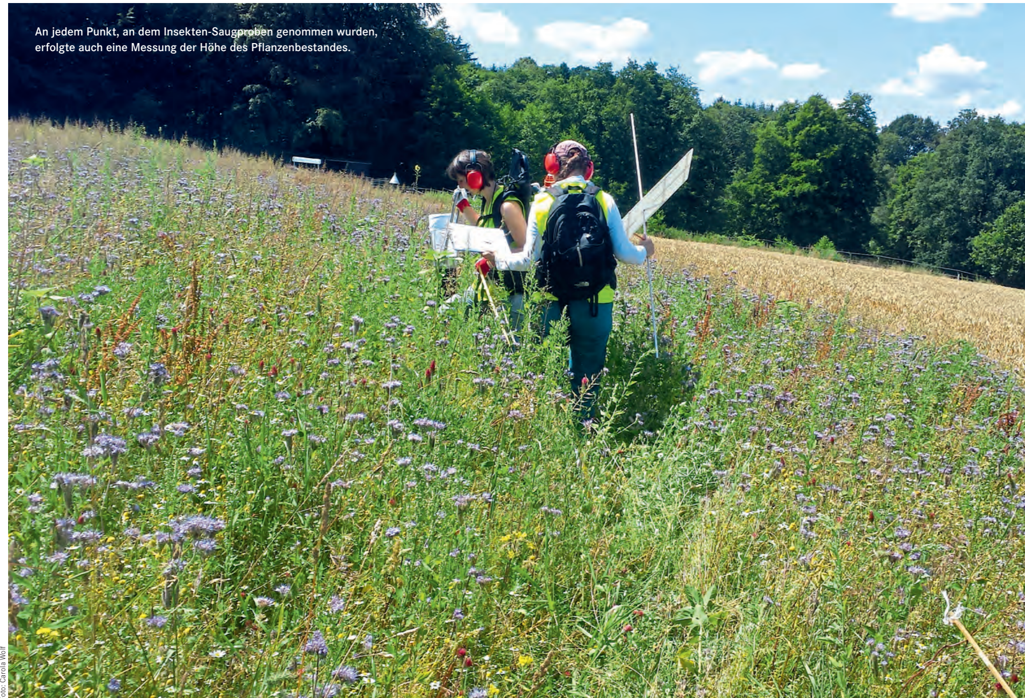
An jedem Punkt, an dem Insekten-Saugproben genommen wurden, erfolgte auch eine Messung der Höhe des Pflanzenbestandes.