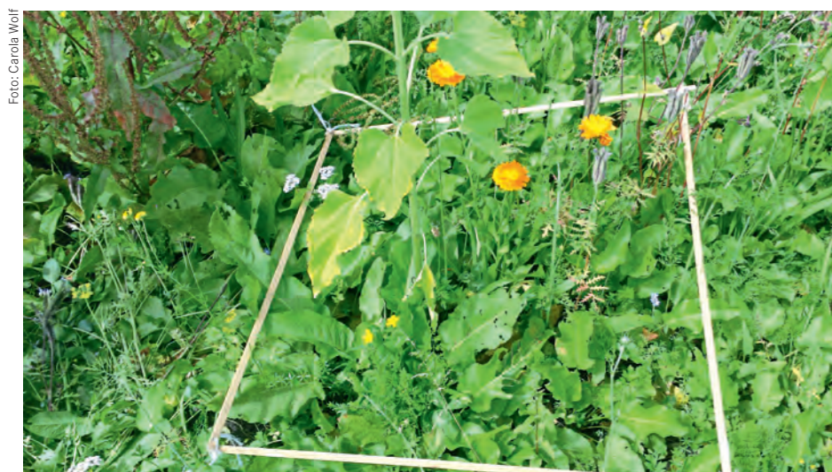
Auf den Versuchsflächen wurden an den Saugproben-Punkten mithilfe eines Wurfrahmens (80x80 cm) die Pflanzenarten und der Deckungsgrad des Aufwuchses bestimmt.