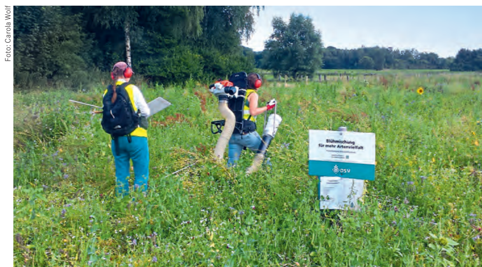
Mit einem Insektensauger wurden an verschiedenen Stellen verteilt über die einzelnen Versuchsflächen Proben entnommen.